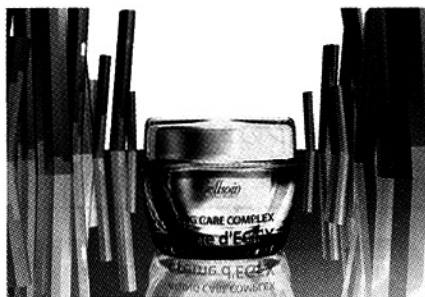
セルソアンEGFXクリーム

EGFブームの火付け役である㈱バイオリック販売(大阪府大阪市)では、9月中旬より『セルソアンEGFXクリーム』を上市する。セルソアンEGFXクリームは、フコキサンチンの化粧品配合に関して特許を有する京都大学とライセンス契約を結んでいる㈱ビーティフィックとの共同開発によるもの。フコキサンチンとミトラカーパススケーパーエキスを配合することを特徴としている。「フコキサンチンはカロテノイドの中で最もRBP(レチノール結合たん白質)との親和性が高く、レチノイン酸様のメラニン色素排泄促進効果がある。しかもレチノイン酸にみられがちな紅斑や皮膚刺激性などの副作用がほとんど無い」という。さらに京都大学では「フコキサンチンによる血管新生抑制とシワ抑制効果」という特許を出願しており、そのライセンス使用権を㈱ビーティフィックが取得しているため、国内では許可なしにフコキサンチン入りの化粧品の製造販売が出来ない状態。